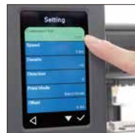
大型カラー液晶ディスプレイ