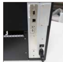
様々なインターフェイスに対応