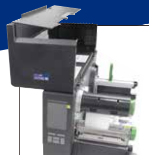
使いやすい折り畳み式ドア