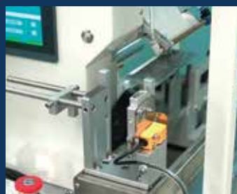
1. ラベルが搬出される