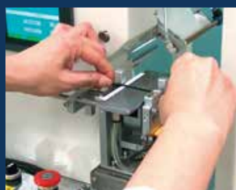
2. ケーブルを押し込む