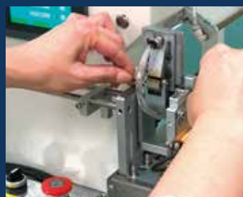
3. 自動機による貼りつけ