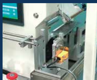
1. ラベルが搬出される