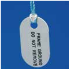
ワイヤー・ケーブル向けラベル B-425