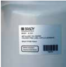
10年*耐候性銘板ラベル B-7531 *社内テスト

STEP2 現場にて M611専用モバイルアプリ「エクスプレスラベル」 をインストールしたスマートフォンやタブレットで印字。 1枚でも複数枚でも必要な枚数だけを印字できる。