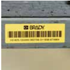
ハロゲンフリーラベル B-423