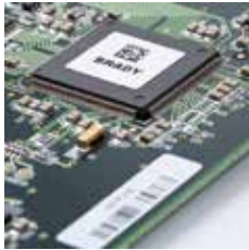
静電気 (ESD) 対策ラベル B-473