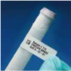
凍結保存向けラベル B-490

ブレイディのラベルは、 連続紙 タイプと 型抜き タイプがあり、サイズも豊富に取り揃えています。これらの他にも多彩に取り扱っています。用途に合ったラベル基材を提案していますのでお気軽にお問い合わせください。