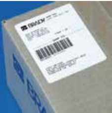
出荷物向け紙ラベル B-424