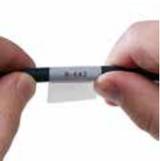
セルフラミネートラベル B-427、B-642