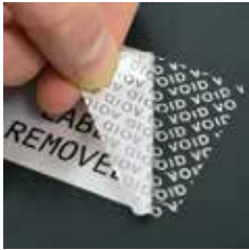
セキュリティラベル B-7546、B-7576