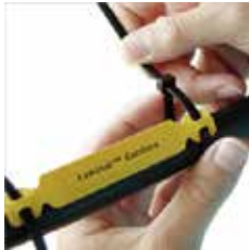
ワイヤー・ケーブル向け ラミネートタイプタグ B-7644