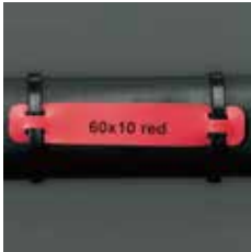
ワイヤー・ケーブル向けタグ B-7598、B-109、B-348