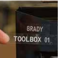
銘板向け透明ラベル B-430