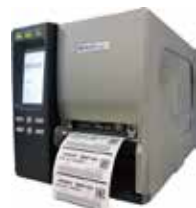
BBP™16Eラベルプリンター 解像度: 600dpi