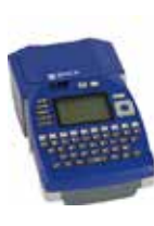
BMP™51ラベルプリンター 解像度: 300dpi