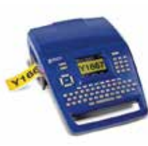
BMP™71ラベルプリンター 解像度: 300dpi