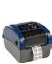
BBP™12ラベルプリンター 解像度: 300dpi