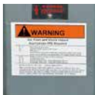
屋外向け警告ラベル