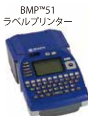
BMP™51 ラベルプリンター