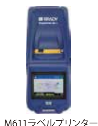
M611ラベルプリンター