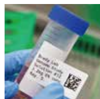
コニカルチューブ