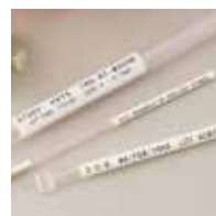
凍結保存用ストロー