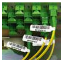
フラッグタイプラベル