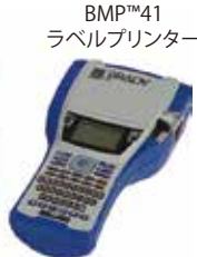
BMP™41 ラベルプリンター