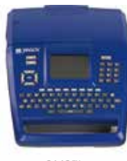
BMP™71 ラベルプリンター