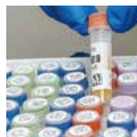
クライオチューブ