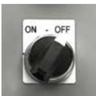
制御盤押しボタン